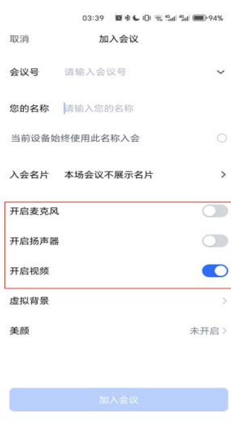
图 2 手机设置界面