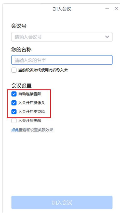
图 2 电脑设置界面

5. 答辩人员进入会议后需保持电脑的麦克风与扬声器处于开启状态，手机的麦克风与扬声器处于关闭状态。设置界面如图 2 所示：