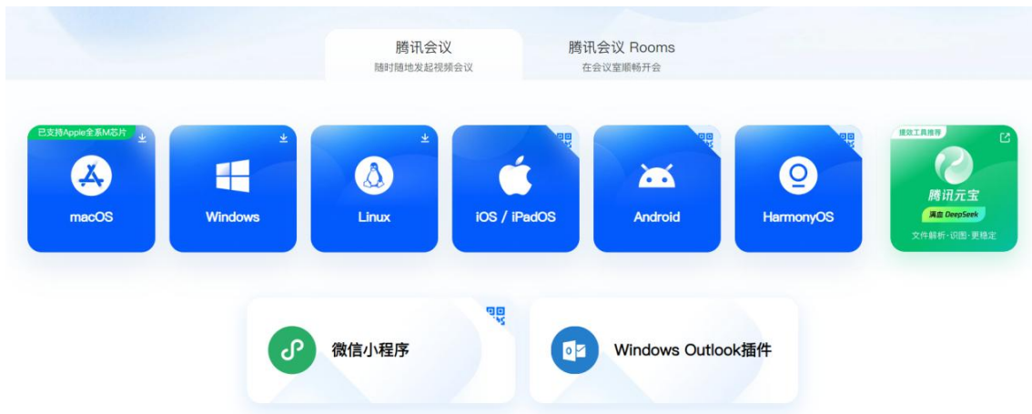
图 3 腾讯会议软件下载界面