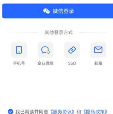
图 6 手机端登录界面

登陆成功后，根据图 7 所示步骤修改名称，名称修改为“职称编号后四位+答辩论文题目”，点击加入会议，输入会议号、会议密码，即可进入等候区，等轮到您开始答辩，工作人员会邀请您进入会场。