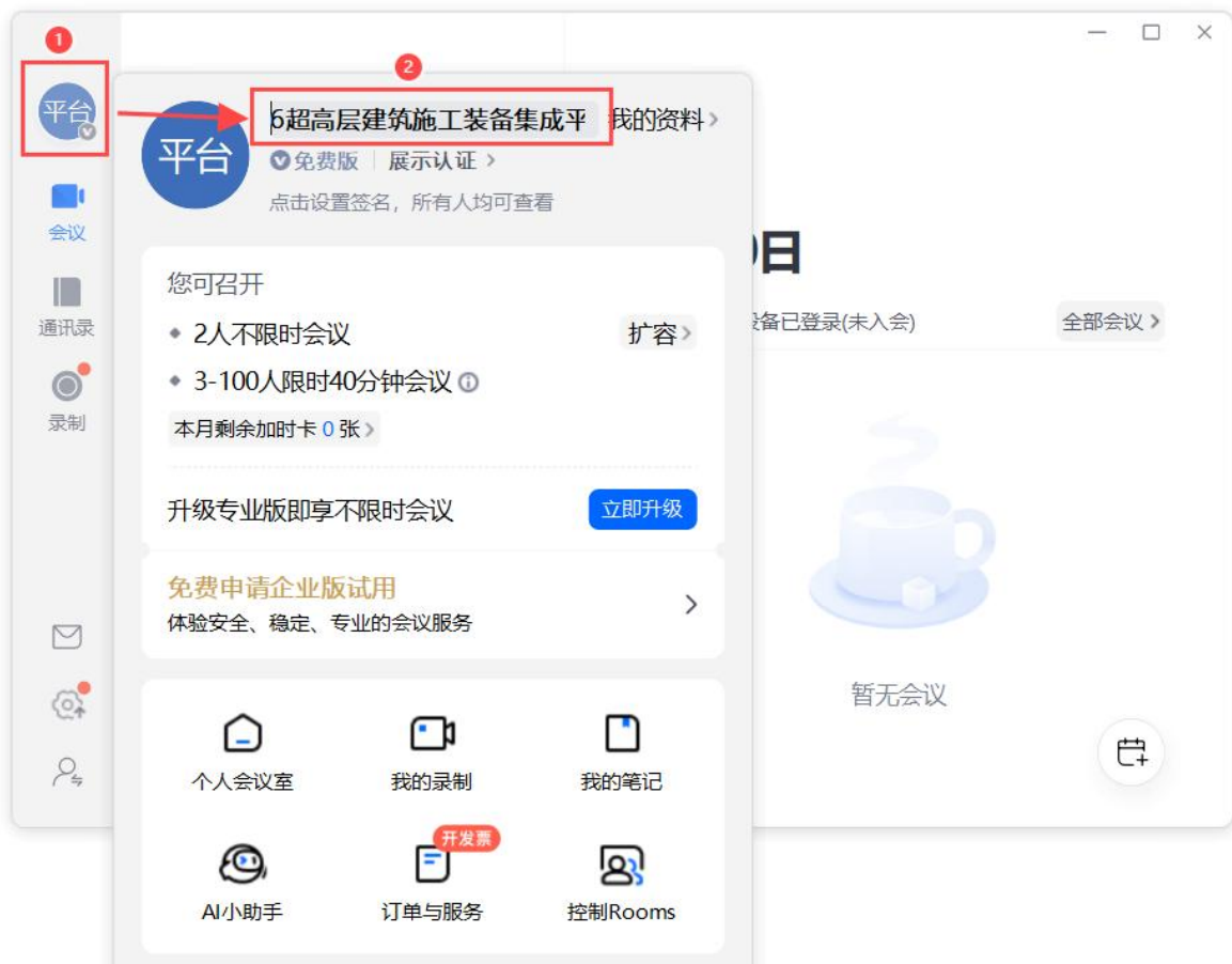
图 5 电脑端修改名称示意图