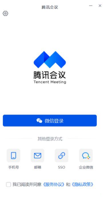
图 4 电脑端登录界面

登陆成功后，根据图 5 所示步骤修改名称，名称修改为“职称编号后四位+答辩论文题目”，点击加入会议，输入会议号、会议密码，即可进入等候区，等轮到您开始答辩，工作人员会邀请您进入会场。