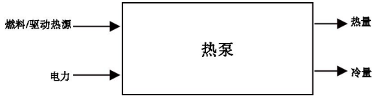
图 5 热泵同时制备冷量和热量的能源输入输出形式

为驱动热源，同时产出热量和冷量两种产品的供能方式。其能源输入输出形式见图 5，碳排放量按式（7）计算：