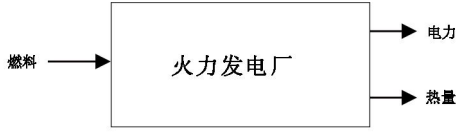
图 2 燃烧燃料或直接利用热泵制备热量的能源输入输出形式