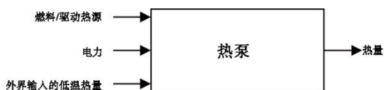
图 4 利用热泵提升热量品位的能源输入输出形式

利用热泵提升热量品位为利用热泵提高输出热量温度或制取蒸汽的过程, 其能源输入输出形式见图 4, 碳排放量按式 (6) 计算: